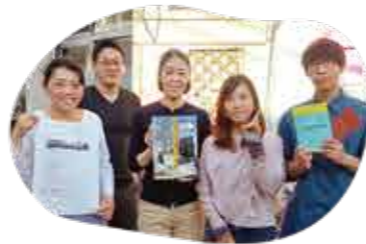
原発についてともに考え今後につながる時間をつくりたいという思いから、11月にツアーの報告会を開催しました

震災当時福島県内の原発でつくられた電気を使っていたのは東京に住む私たちです。今もその構造は変わっていません。避難を余儀なくされ、避難先も転々とし、生きる希望を失い自ら命を絶たれた方など、震災に関連して亡くなられた方は福島県で2,330人。今も増え続けています。政府は原発の次世代革新炉への建て替えや運転期間延長を決定しましたが、原発は安全ではなく、事故の後始末もできないことは明らかです。福島現状を一人でも多くの人に知ってもらい、自分のこととして真剣に向き合ってほしいと思いました。原発事故を2度と起こさないために私たち一人ひとりから、そして葛飾から、自然エネルギー由来の電気にかえていく必要があります。